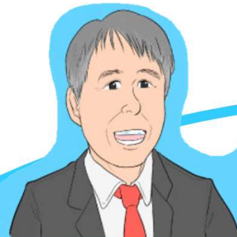
妙中 義之 (医師)

半世紀にわたる医工連携の先駆者。 国の医療機器開発推進事業のリー ダー (AMED-PS)。医療機器開発と実 用化達成まで、何でも相談できます。